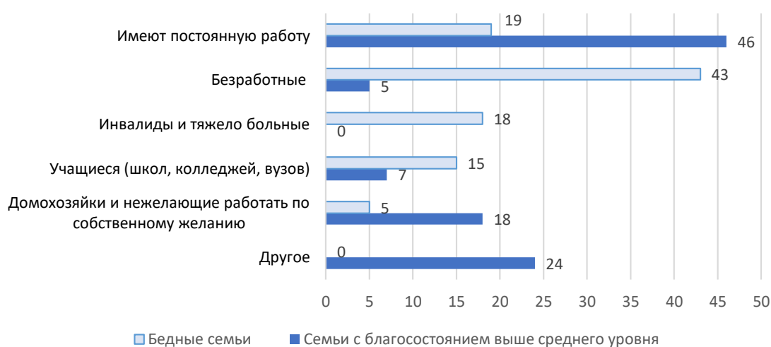
Рис.4. Состав семей по статусу занятости, в % от общего количества членов семьи