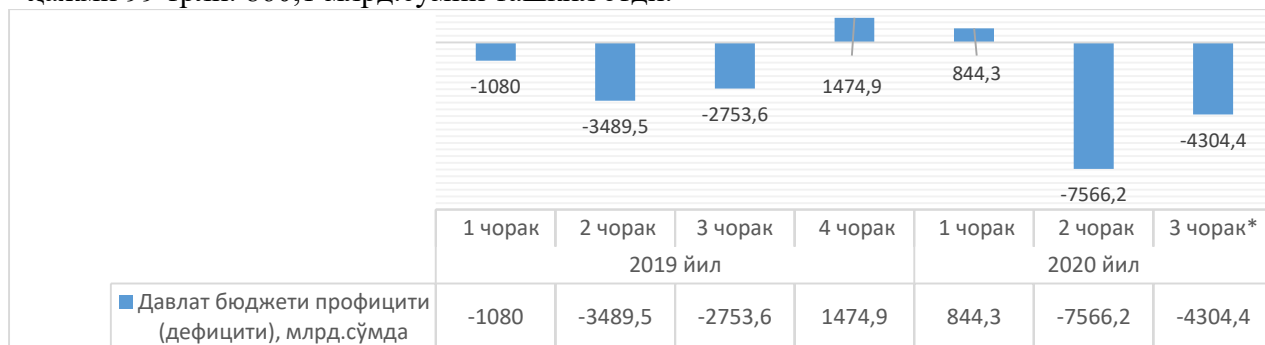
3-расм. Ўзбекистон Республикаси давлат бюджети профицити (дефицити), млрд.сўмда 4

Давлат бюджетининг 2020 йил 1-ярим йиллик харажатлари 64 трлн. 879 млрд. сўмни ёки ЯИМга нисбатан 25,4 фоизни ташкил этди. Ҳисобот даврида бюджетдан 28 трлн 100 млрд. сўмлик иш ҳақи ва унга тенглаштирилган тўловлар ўз муддатларида тўлик молиялаштирилиши таъминланди ва бу жами ярим йиллик харажатларнинг 48,4 фоизини ташкил қилди. 2020 йилнинг 9 ойига кўра эса давлат бюджети харажатларининг умумий ҳажми 99 трлн. 860,1 млрд.сўмни ташкил этди.