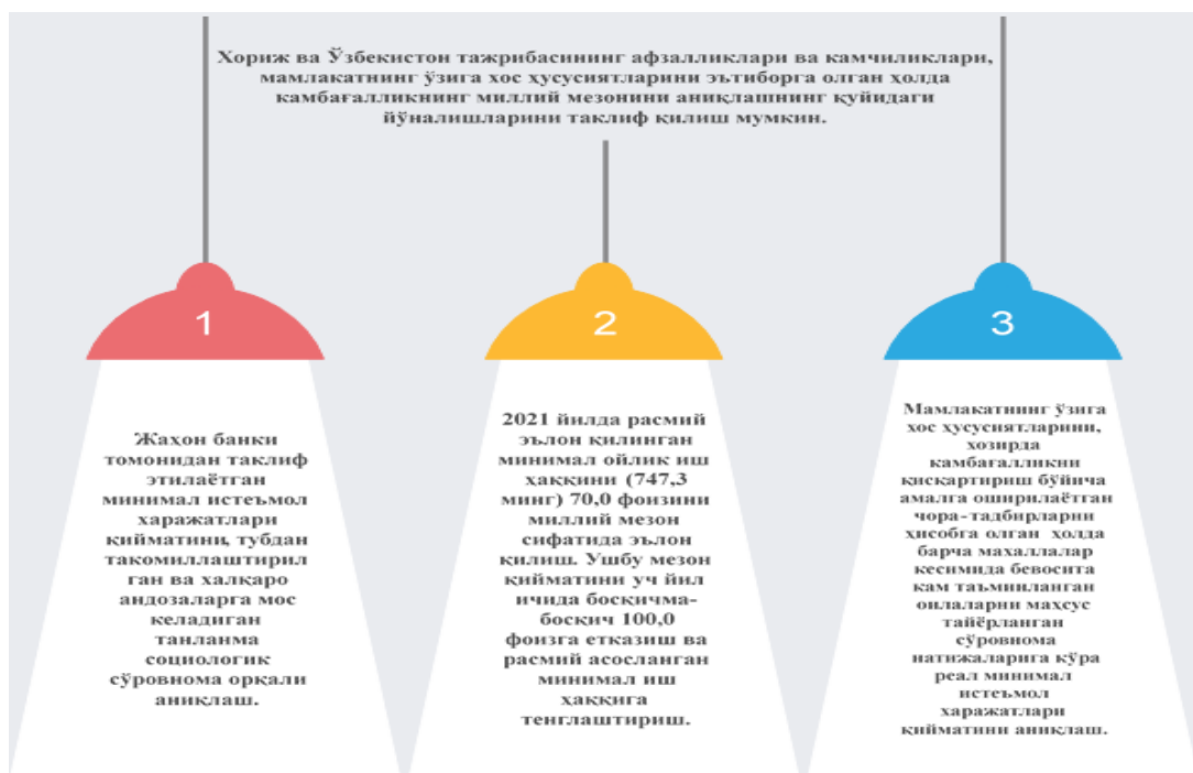
3 – Расм. Ўзбекистонда камбағаллик мезонини аниқлаш бўйича таклифлар

Жаҳон банки маълумотларига кўра, 736 миллион киши (аҳолининг 10 фоизи) ўта қашшоқлик шароитида (кунига 1,9 доллардан кам даромадга эга), дунё аҳолисининг деярли ярми – 3,4 млрд киши – кунига 5,5 доллардан кам тушумга эга. Камбағаллик даражаси энг юқори қитъа Африка бўлиб, сайёрамиздаги энг камбағал мамлакатлар – Конго демократик республикаси (ўта қашшоқлик даражаси – 77,1 фоиз) ва Мадагаскар (77,6 фоиз).