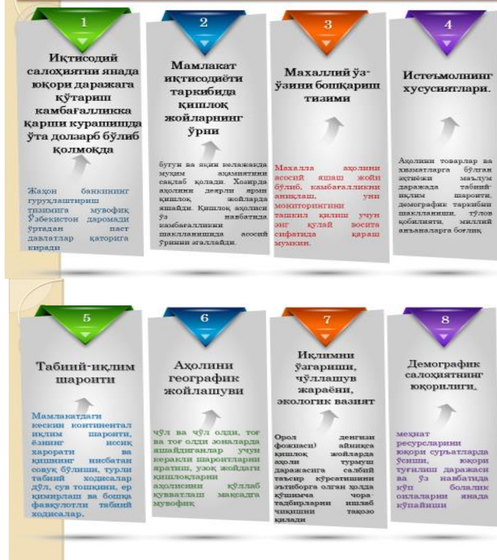
1 – Расм. Ўзбекистонда камбағалликнинг ўзига хос хусусиятлари

1. Иқтисодий салоҳиятни янада юқори даражага кўтариш камбағалликка қарши курашишда ўта долзарб бўлиб қолмоқда. Жаҳон банкининг гуруҳлаштириш тизимига мувофиқ Ўзбекистон даромади ўртадан паст (1036-4045 доллар йилига) давлатлар қаторига киради. Ушбу ҳолат, яъни иқтисодиёт салоҳиятни барқарор ошириш сиёсатини янада долзарблигини кўрсатади.