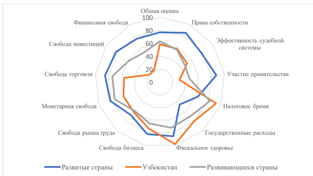
Рис. 4. Диаграмма разрыва между Узбекистаном, а также развитыми, развивающимися странами по компонентам по Индексу Экономической свободы 2021

Об основных причинах, влияющих на рост теневого сектора, можно сделать вывод при анализе Индекса экономической свободы (Index of Economic Freedom). По данному индексу, опубликованному в 2021 году, Узбекистан занял 108-е место из 178 поднявшись на 6 позиций. Уровень экономической свободы в Узбекистане составил 58,3 балла из 100 9 . Несмотря на достигнутые результаты экономика республики остается преимущественно несвободной, что в конечном счете способствует уходу предпринимателей в теневого сектор (рис. 4).