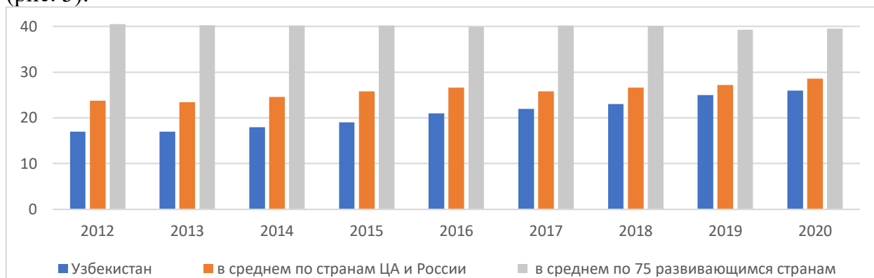
Рис.3. Динамика изменения Индекса восприятия коррупции 2020 (CPI - Corruption Perception Index) Узбекистана, Центральной Азии и России, а также 70 развивающихся стран (0 — крайне высокий, а 100 - крайне низкий уровень коррупции)

Perception Index) 3 за 2020 год. В этом рейтинге Узбекистан занял 146-е место из 180. Страна поднялась на семь позиций по сравнению с 2019 годом, но все еще осталась на достаточно низком месте. Из 100 баллов (где 0 — крайне высокий уровень коррупции, а 100 - крайне низкий) страна набрала лишь 26. Из рис. 2 можно видеть индекс восприятия коррупции по полученным баллам уступает в среднем не только странам Центральной Азии и России, но и 70 развивающимся странам, схожих или сопоставимых с Узбекистаном по показателям уровня экономического развития (рис. 3).