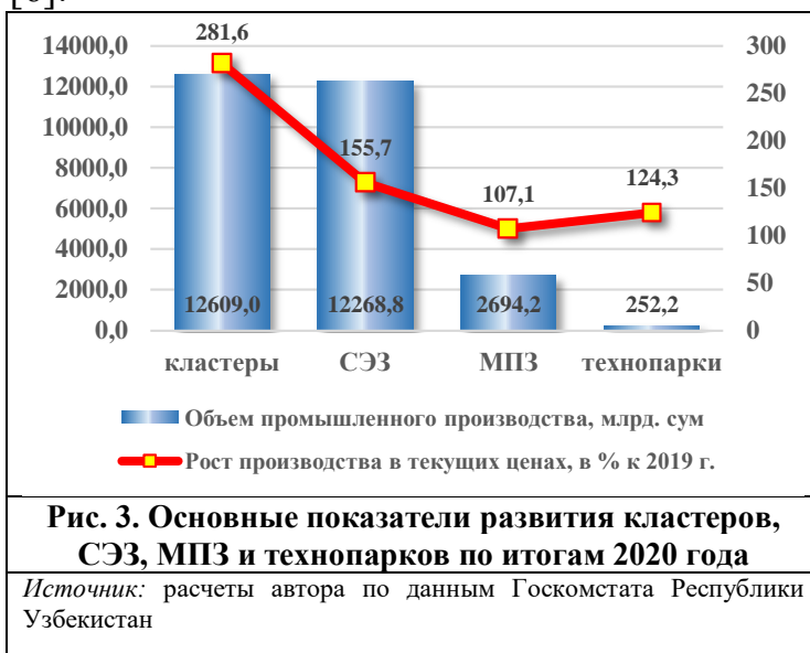
Рис. 3. Основные показатели развития кластеров, СЭЗ, МПЗ и технопарков по итогам 2020 года

В целях оказания помощи компаниям в налаживании надежных партнерских отношений между предприятиями, как покупателями, так и заказчиками, в 2019 году был открыт портал