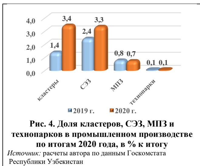
Рис. 4. Доля кластеров, СЭЗ, МПЗ и технопарков в промышленном производстве по итогам 2020 года, в % к итогу